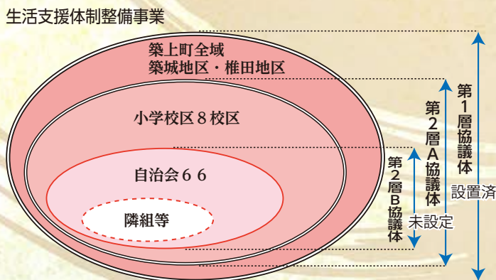
地域福祉圏域のイメージ図（例）

町全域から自治会単位まで、それぞれで協議の場及びコーディネートなどを設けていただき、自分たちの地域でいつまでも住み続けるための協働施策を話し合います。昨年度までは、第一層協議体のみの活動で買い物難民の対応としてメタセの杜、セブンイレブンの移動販売について協議を行いました。自治会でも良い案が出来ましたら、社協まで情報の提供をお願いします。