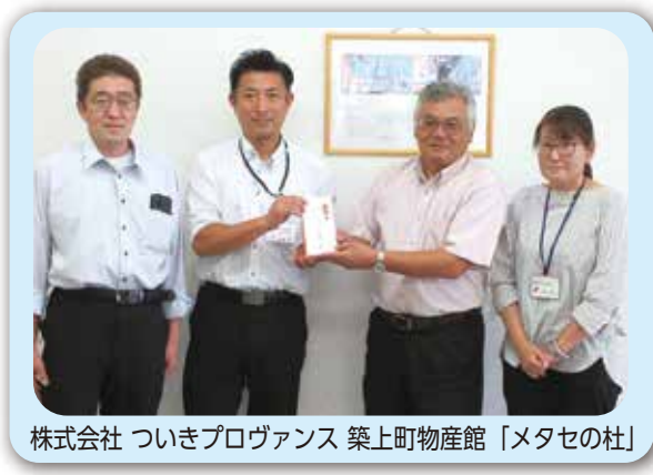
株式会社 ついきプロヴァンス 築上町物産館「メタセの杜」

多くのご支援を頂きました。株式会社 ついきプロヴァンス 築上町物産館 メタセの杜 様 社会福祉法人 大幸会様 から寄付を頂きました。 ありがとうございます。