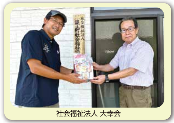
社会福祉法人 大幸会