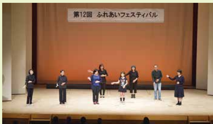
●ふれあいフェスティバル

具体的な事業として、介護に関する相談、配食サービスをはじめ、車いすの貸し出し、介護用電動ベットの貸し出し、高齢者等の見守りネットワーク事業、ボランティア活動の支援、児童青少年福祉、母子父子福祉等さまざまな分野での事業を行っており、地域の皆様や民生委員・児童委員、社会福祉施設・社会福祉法人等の社会福祉関係者、保健・医療・教育などの関係機関の参加・協力のもと地域福祉の増進に取り組んでいます。