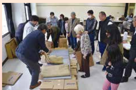
ダンボールベッド