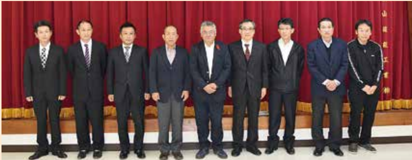
築上町社会福祉法人連絡会 参加法人 (順不同)

町内の高齢者施設、障がい者施設、保育園などを運営している社会福祉法人11団体で、法人間の横の繋がりの強化や様々な地域福祉の問題を解決するために設立しました。それぞれの得意なことを活かし、地域のニーズに対応できる体制づくりを目指します。