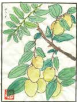
(文とイラスト) 広報部会 大森 キヨ子