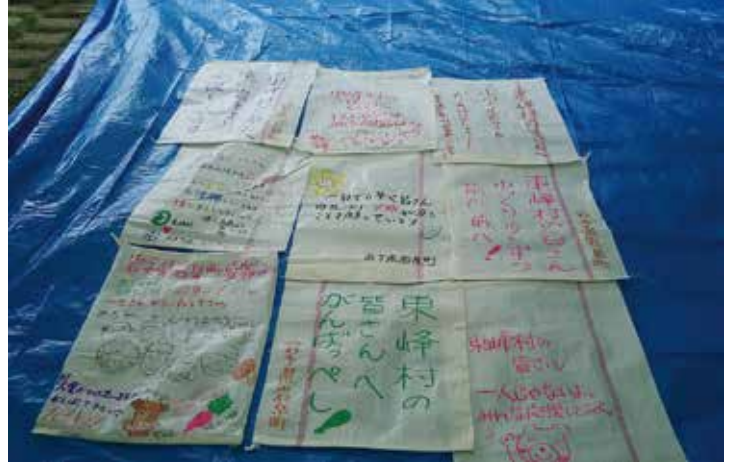
▲岩手県岩泉町のみなさんからの応援メッセージ