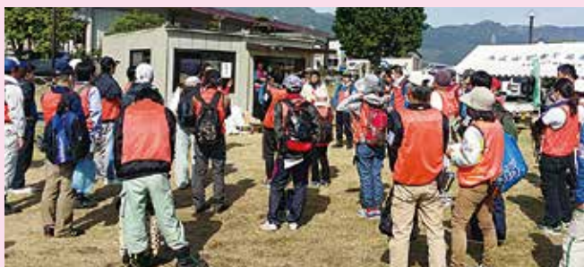
災害ボランティア

共同募金は、各都道府県で大規模災害が発生した時に即座に災害支援を行えるよう、毎年の募金額の一部を「災害等準備金」として積み立てています。東日本大震災や熊本地震等においても、被災者支援のための災害ボランティアセンター設置・運営等の復興支援に役立てられました。