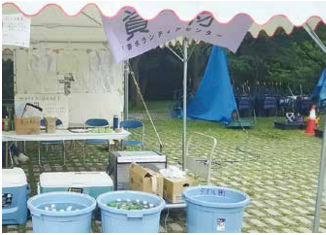
▲ボランティアセンター資材班