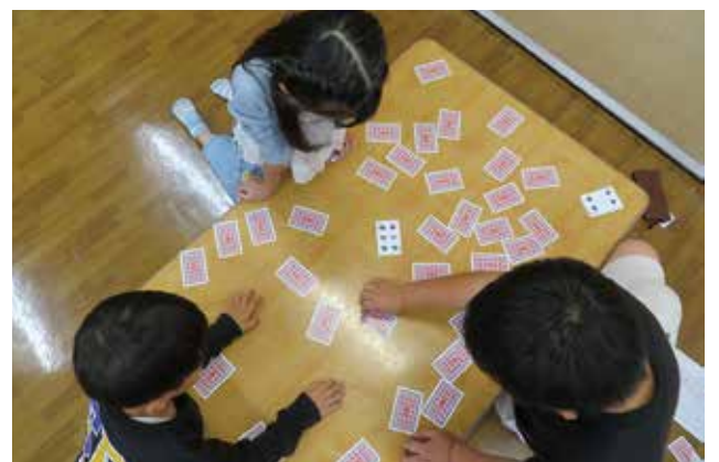
放課後児童クラブ室