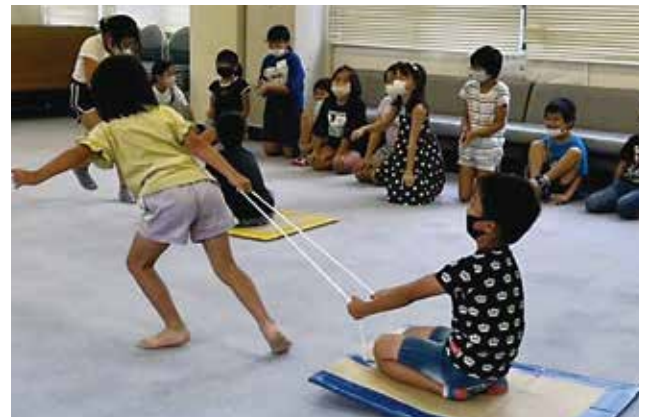
築上町椎田社会福祉センター「自愛の家」