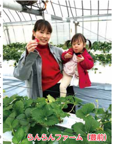
らんらんファーム (豊前)

私は、東北出身で夫の転勤で築上町にやってきました。縁もゆかりもない土地で、寂しさ&暇を持て余すのでは？と思い、引っ越し前から転職活動をして、引っ越して1ヵ月で働き始めました。すると、入職と同時に妊娠がわかり、里帰り出産を経て、子供が2ヵ月になった頃に、またこちらに戻ってきました。コロナ禍で行政の関わりも少なく、もちろん近所には知り合いもいないため、慣れない育児と夫の激務によるワンオペで毎日無事に一日が終わるのを願う毎日でした。他のママたちとも話してみたいなあと思い、子育てイベントに参加したところ、子育てサークルについてとあるママから紹介されました。正直、「知っている人もいないし…」「どんな集団かわからないし…」と気後れ。行くか迷