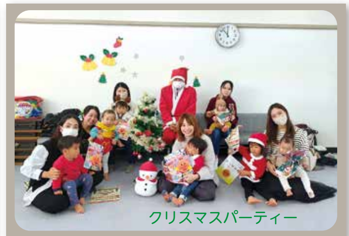
クリスマスパーティー