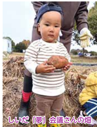
しいだ「夢」会議さんの畑

っていたため、SNSで検索。すると、イベントに参加してイキイキと動く子供たちやそれを見て楽しそうにしているご家族の写りがたくさん！“まずは体験だけでもOK”という謳い文句を見て、行ってみることにしたのでした。そこには、歳の近い子供がたくさんいて、社協の職員さんたちともキャッキヤしている素敵な空間が…！その場で入会を決め、様々なイベントに参加させてもらいました。