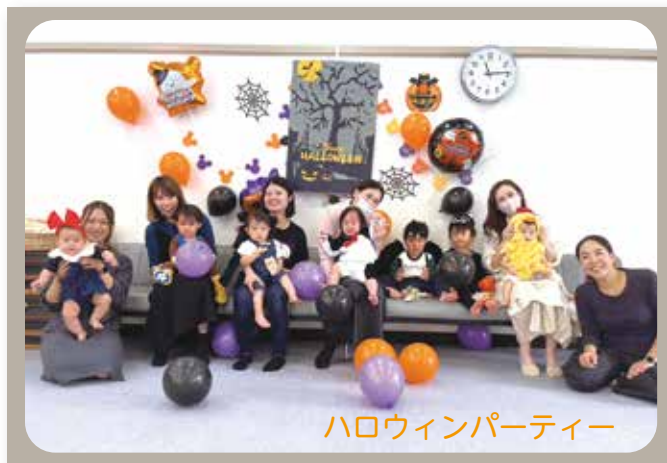
ハロウィンパーティー

保育園や家庭で普段できない体験をさせてみたい、パパも育児に参加してほしい！そんな方々、連絡をお待ちしております！子育てパパさんやママさんも遠慮なく、まずは体験だけでもどうぞ～(/・ω・)/