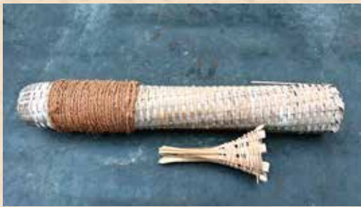
(※1) いっちゃん…ヨシノボリ (※2) さかてば…鰻や魚を捕まえる竹製の道具。 その中に餌を入れて水中に沈めておくと、 餌につられて鰻や魚が入り、出られなくなる。

伝法寺を過ぎるころからか、川は葦が生い茂って、川面がほとんど見えません。下流に行くほど、ひどくなり、川ではなく、草原か藪に見えてきます。幼い頃、いっちゃん（※1）と戯れ、アユを追いかけて、さかてば（※2）でウナギを取っていたあの清流はどこへ行ってしまったのでしょうか。昔は毎年大水が出て、葦も流されてきれいになっていたのではありません。最近が山もきれいに植林されて、洪水もなくなりましたからでしょうか。清流をよみがえらせる方法はないのでしょうか。