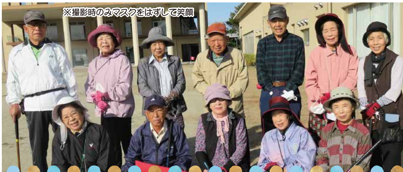
※撮影時のみマスクをはずして笑顔

梅の清楚で静寂な空間からソメイヨシノの輪一輪の花々が心を解きほぐし快く心技体なりました。年度の集大成の時期でもあります。一年間良いことも良くなかったこともすべて受け入れ、自分をほめてあげて、次年度に向けての栄養として良い花を咲かせる準備をいたしましょう。築上町社会福祉協議会は応援します。