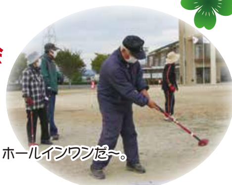
ホールインワンだ〜。

健康面はもとより、人との交流によって心の健康も維持され、健康寿命の延伸につながる事が期待される今回の活動でした。